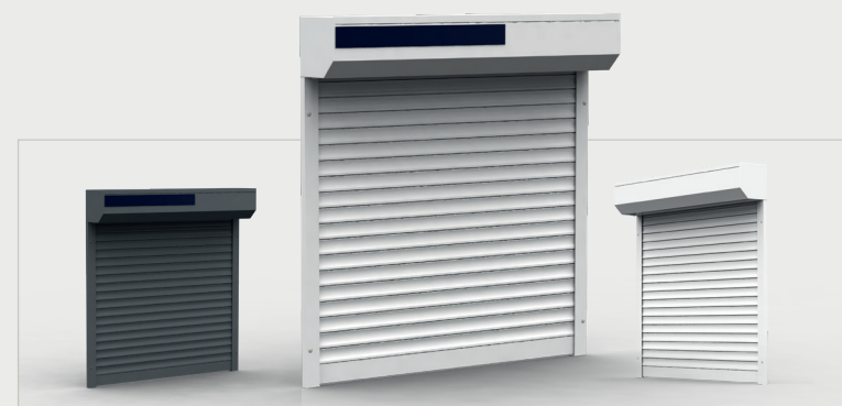
VR-R40 afgeschuind/rond VR-R40 koppel VR-R44 VR-R55